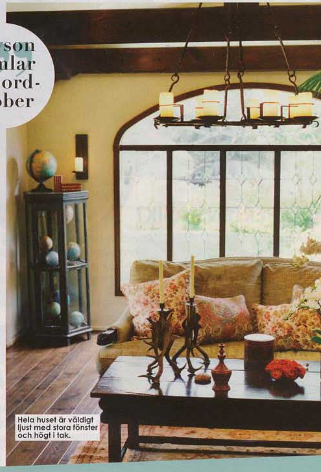
Hela huset är väldigt ljust med stora fönster och högt i tak.