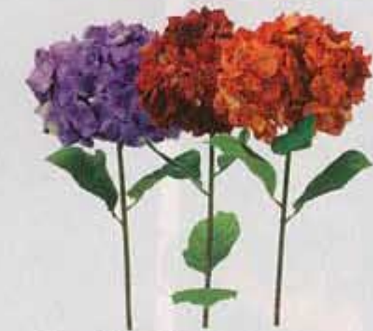
Konstgjord blomma "Smycka" från Ikea, 49 kr