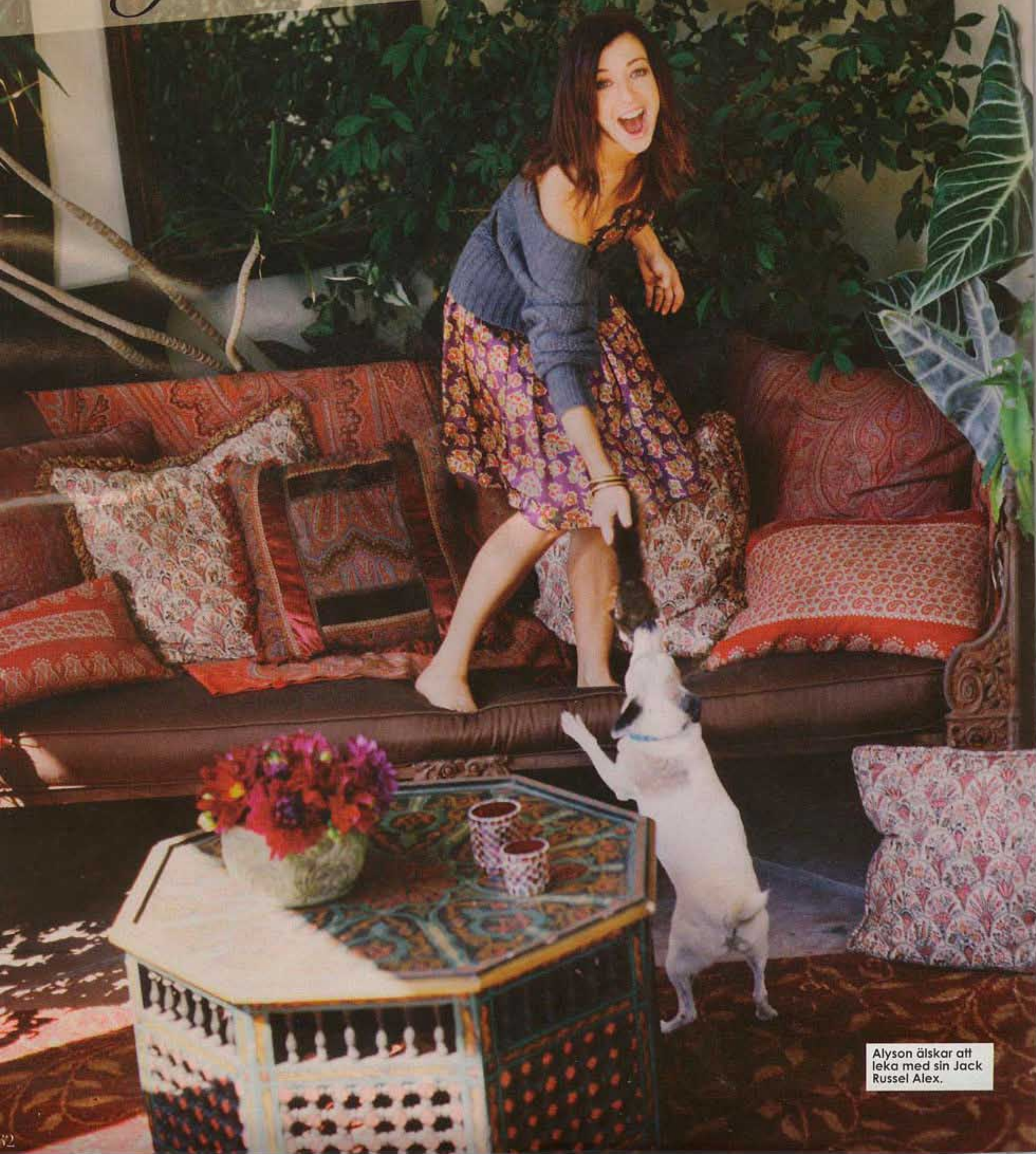
Alyson älskar att leka med sin Jack Russel Alex.

Högt i tak, stora fönster, orientaliska mattor och kuddar från 1700-talet. Skådespelerskan Alyson Hannigans hem är fyllt av auktionsfynd och exklusiva möbler. Följ med in och inspireras av hennes marockanska stil.