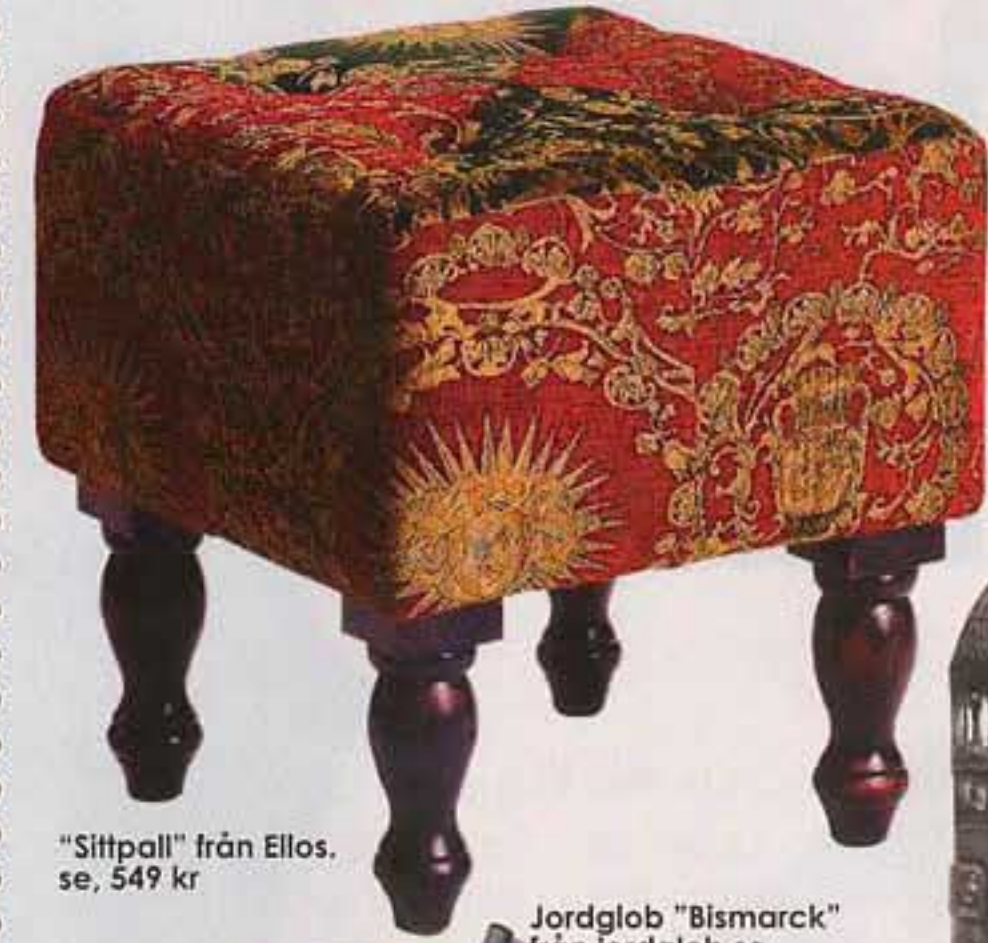
"Sittpall" från Ellos.se, 549 kr