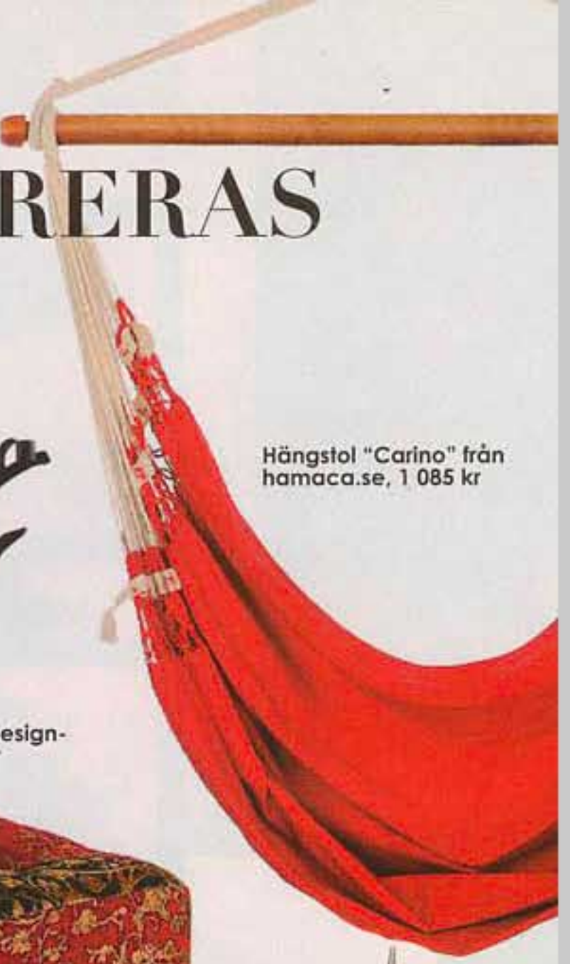
Hängstol "Carino" från hamaca.se, 1 085 kr