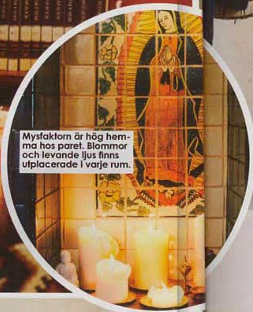
Mystfaktor är hög hemma hos paret. Blommor och levande ljus finns utplacerade i varje rum.