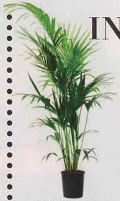
Krukväxt "Howea Forsteriana" från Ikea, 699 kr