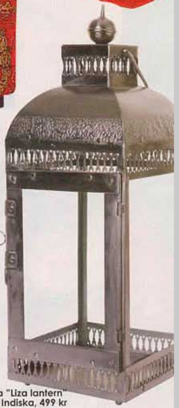
Ljuslykta "Liza lantern" från Indiska, 499 kr