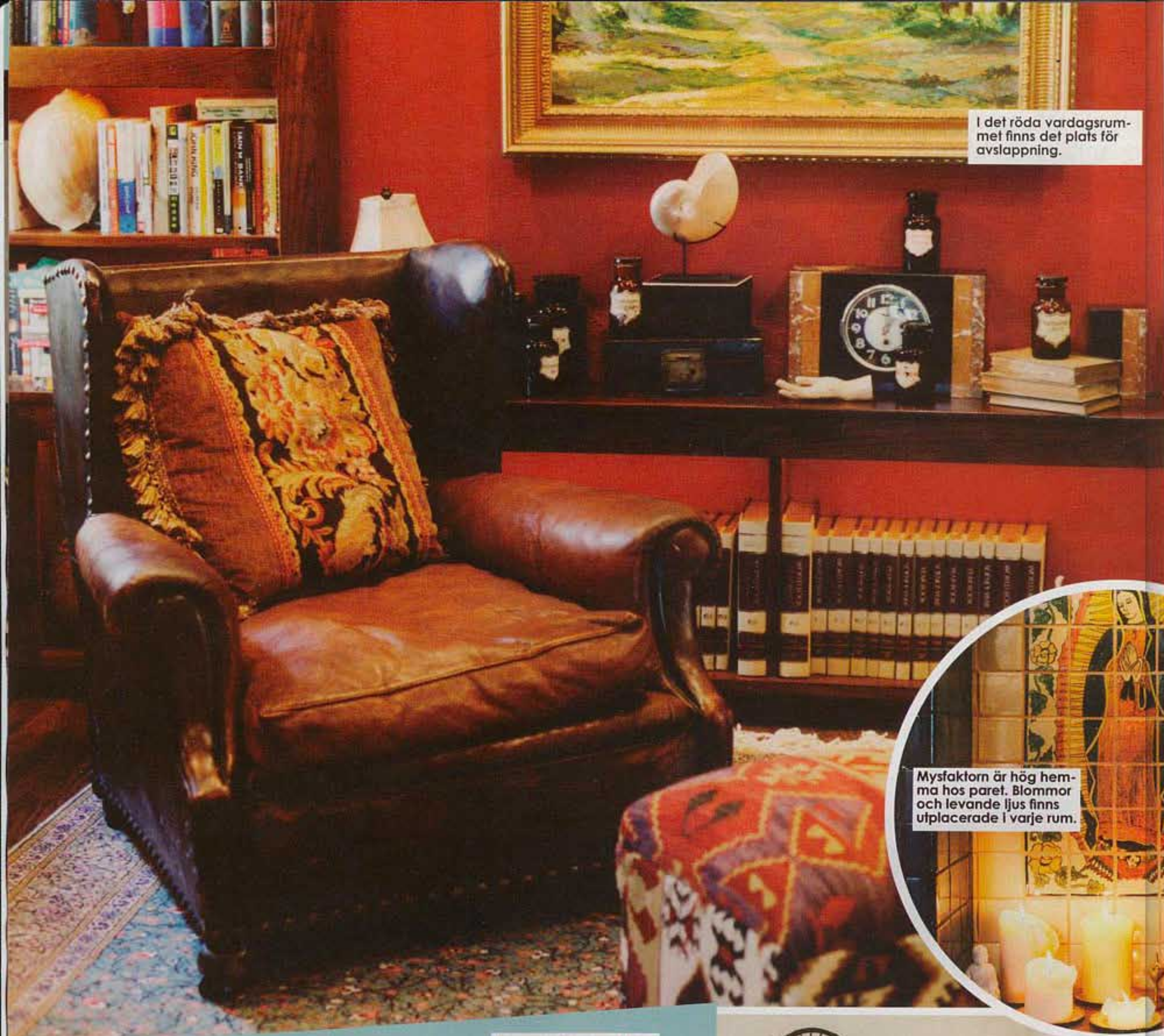
I det röda vardagsrummet finns det plats för avslappning.