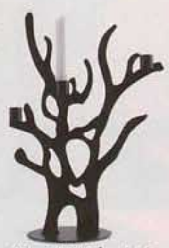
"Ljusträd" från design-online.se, 449 kr