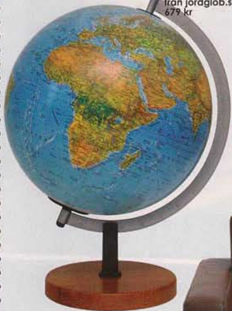
Jordglob "Bismarck" från jordglob.se, 679 kr