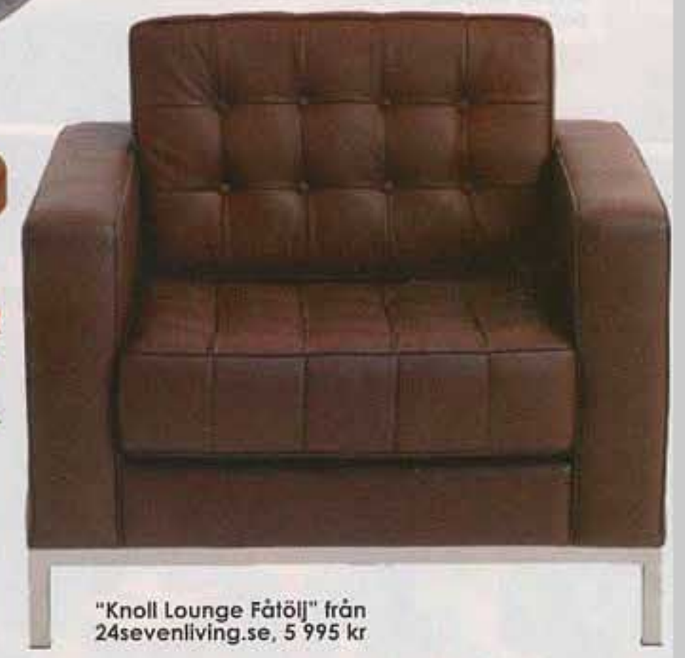
"Knoll Lounge Fåtölj" från 24sevenliving.se, 5 995 kr