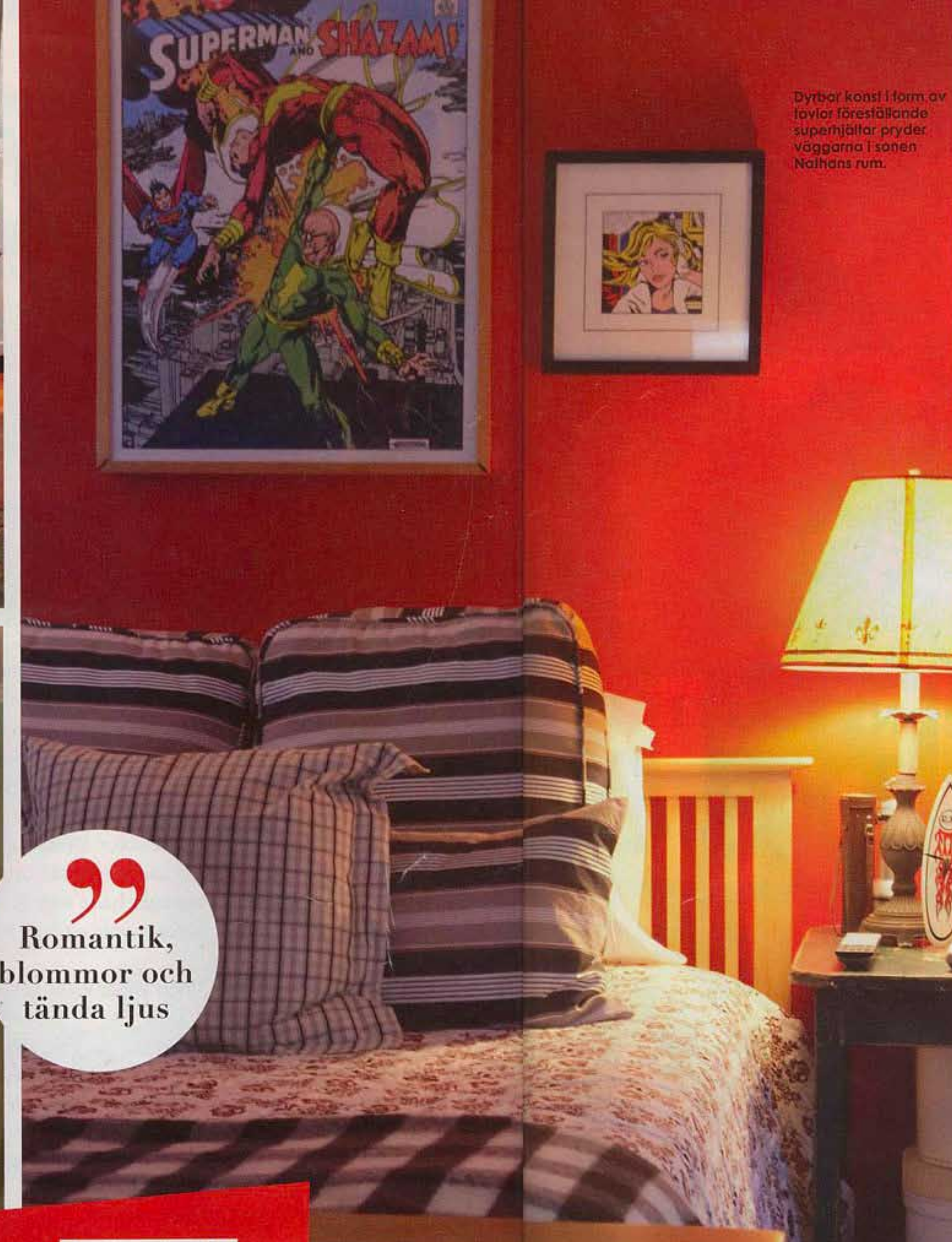
Dyrbar konst i form av tavlor föreställande superhjältar pryder väggarna i sonen Nathans rum.