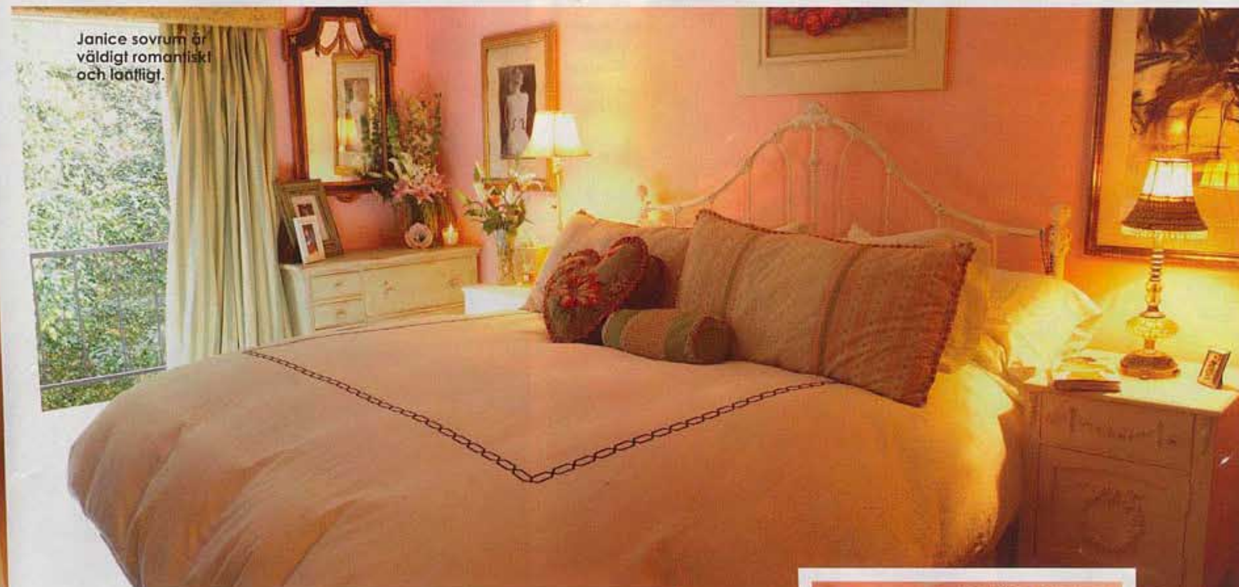
Janice sovrum är väldigt romantiskt och lafligt.

J anice Dickinson har jobbat som supermodell men kan numer även titulera sig som skådespelerska, fotograf, modellscout och före detta domare i tv-succén "Americas Next Top Model". Men hon tröttnade på att vara domare i tv-serien och försöker istället sig på en karriär med en egen serie.