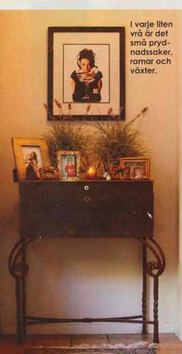
I varje liten vrå är det små prydnadsaker, ramar och växter.