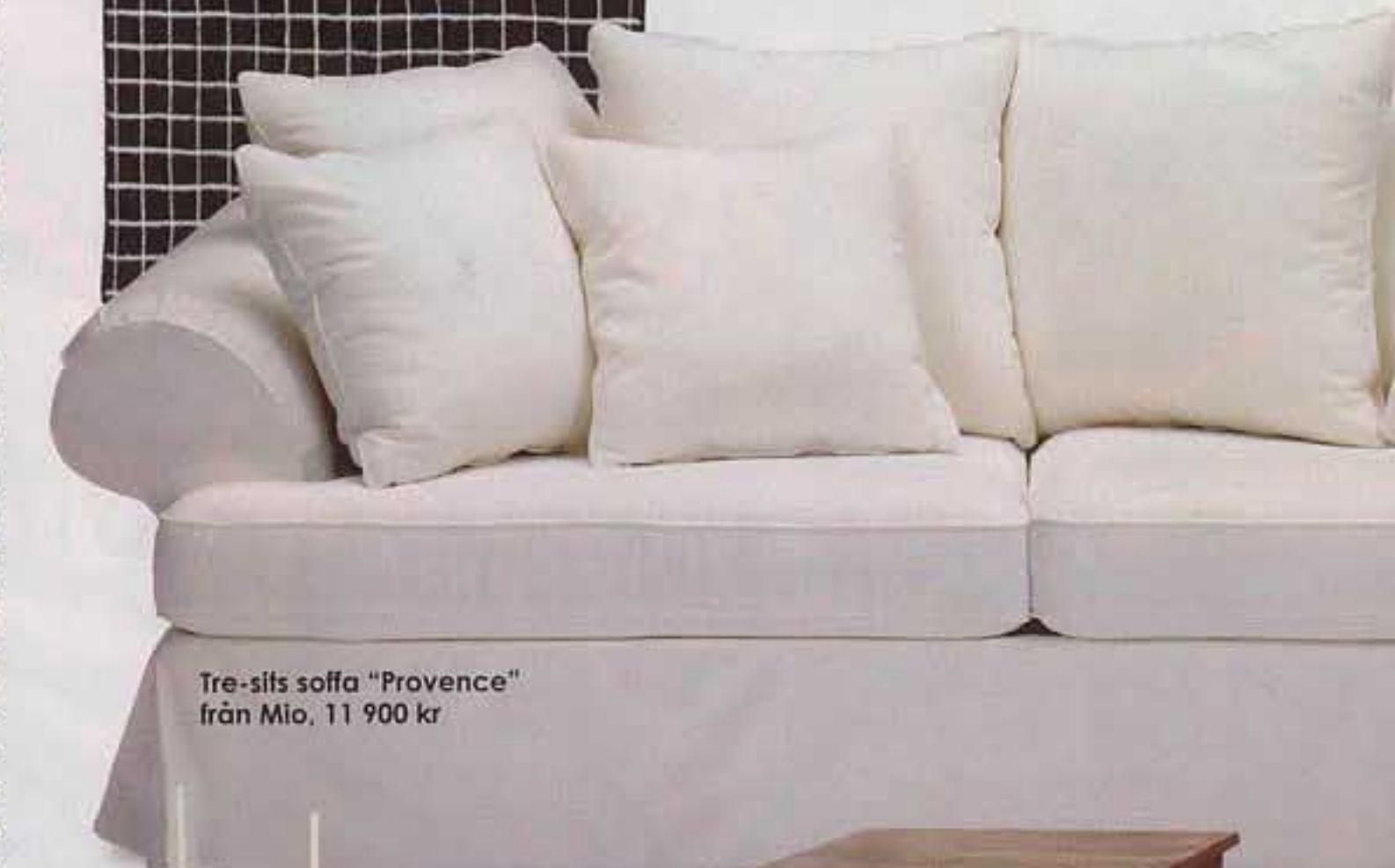
Tre-sits soffa "Provence" från Mio, 11 900 kr