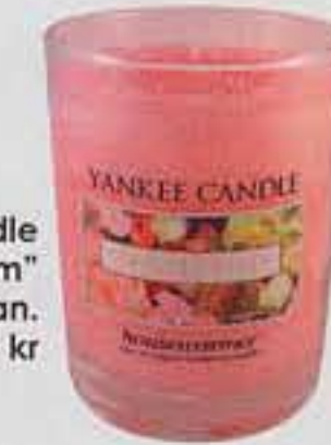
"Yankee Candle Lotus Blossom" från spastugan.se, 159 kr