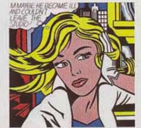
Affisch gjord av Roy Lichtenstein från easyart.se, cirka 325 kr