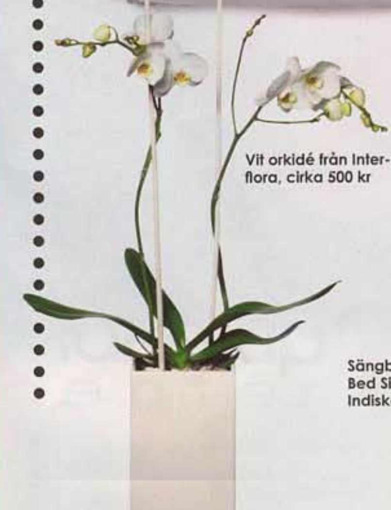
Vit orkidé från Interflora, cirka 500 kr