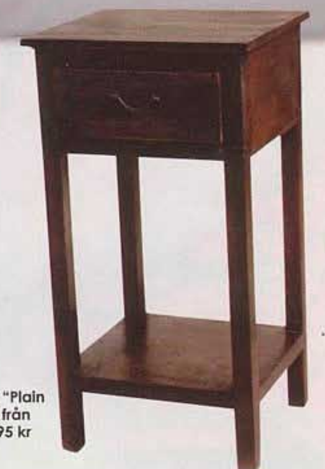
Sängbord "Plain Bed Side" från Indiska, 995 kr