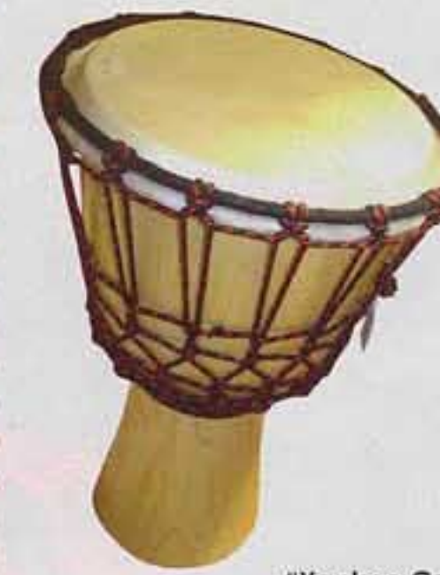
Handgjord bongotrumma från ostamansmusik.se, 1 095 kr