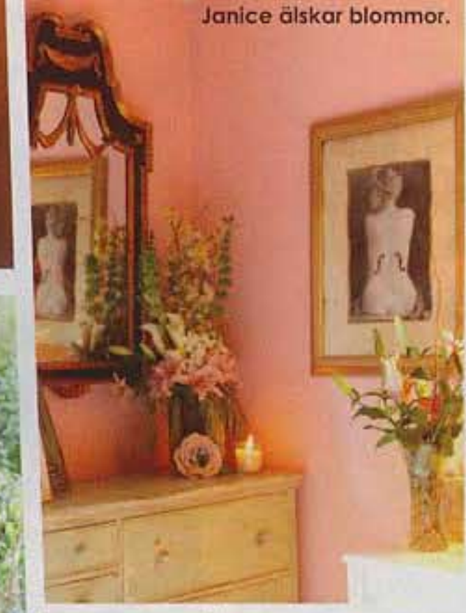
Janice älskar blommor.

– Det jag älskar med modellvärlden är hur det aldrig, aldrig är de som var populärast och ansedda som sötast i skolan som lyckas i den här branschen. De som blir de bästa modellerna är nördarna, de där plattbröstade tjejerna i tandställning som var så långa att ingen kille ens ville prata med dem. De som under hela sin uppväxt fick höra hur underliga de var. Det är de, de fula akungarna, jag letar efter, säger Janice i en intervju i SvD. Janice älskar att umgås med sina barn och hon och dottern Savannah brukar shoppa tillsammans. De sågs nyligen promenera längs Robertson Boulevard efter att ha varit inne och köpt kläder på Kitson. När hon inte shoppar med dottern är hon gärna ute och äter lunch med sina vänner. Ett av hennes favoritställe är Mortons Steakhouse på Melrose Avenue i Hollywood.