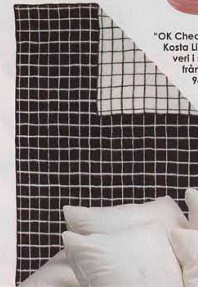
"OK Check" från Kosta Linnewäveri i svart/vit från frapp.se, 949 kr