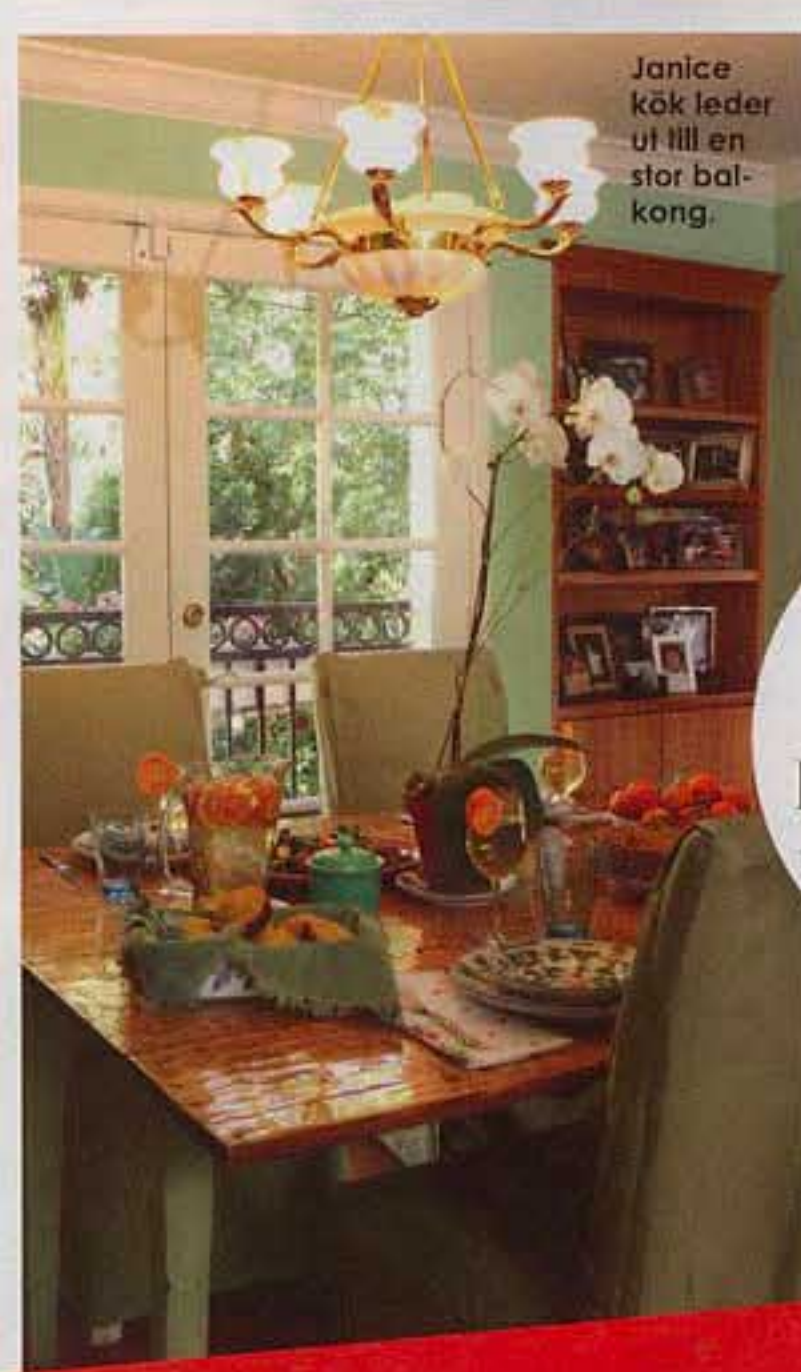
Janice kök leder ut till en stor balkong.