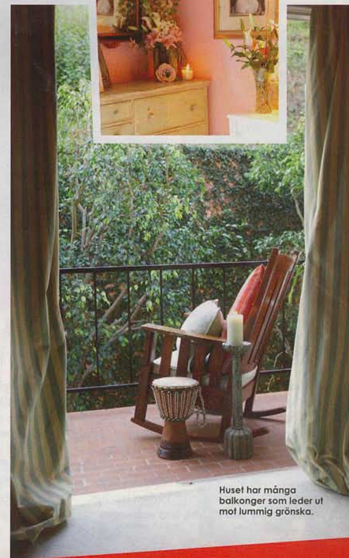
Huset har många balkonger som leder ut mot lummig grönska.