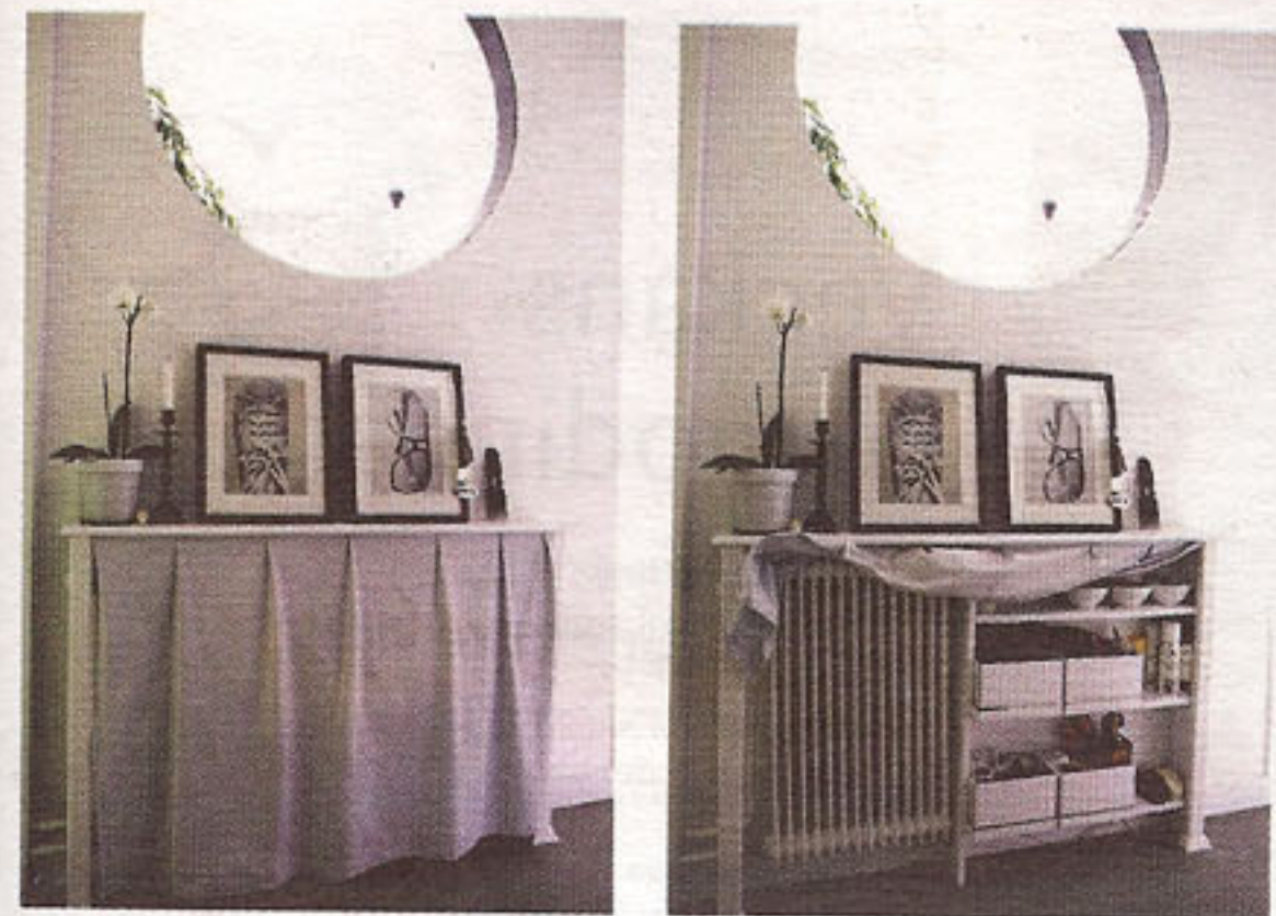
Ett draperi under en smal hylla...