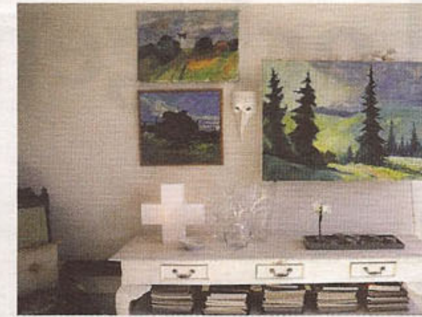
En vanlig tavla ...