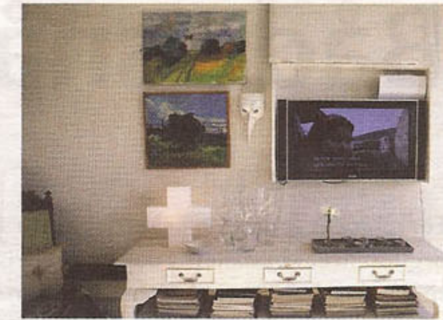
... kan dölja en ful platt-tv.