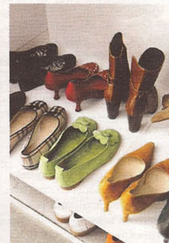
I skohyllorna lägger Ann Blanchester diskmaskinsunderlägg - då blir det lätt att städa bort grus och garderoben skadas inte.